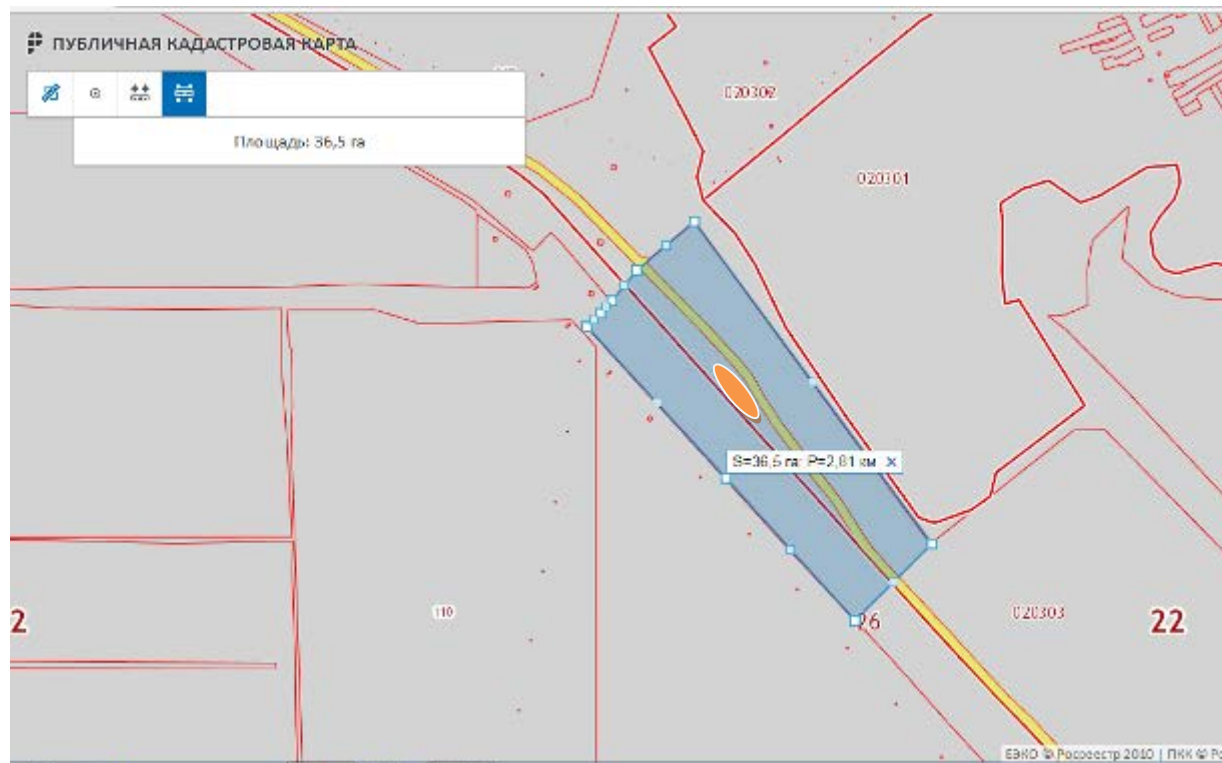
Схема границ карантинной фитосанитарной зоны по повилке на земельном участке с кадастровым номером 22:26:020303:308