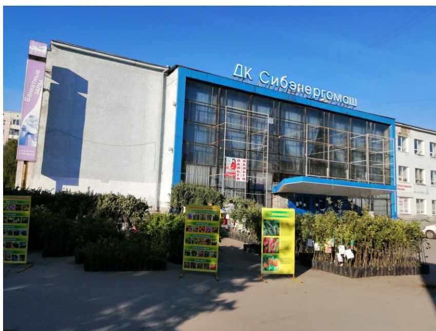
Реализация саженцев без информации о сортовой принадлежности, происхождении и качестве по адресу: г. Барнаул, пр-т Ленина, 147, на территории, прилегающей к ДК «Сибэнергомаш».

По результатам мероприятий, проведенных с целью выявления фактов непосредственного обнаружения правонарушений (рейды) в местах уличной сезонной торговли пакетированными семенами, посадочным материалом плодовых, ягодных и цветочных растений, луком-севком, в отношении физических лиц возбуждено 339 административных дел.