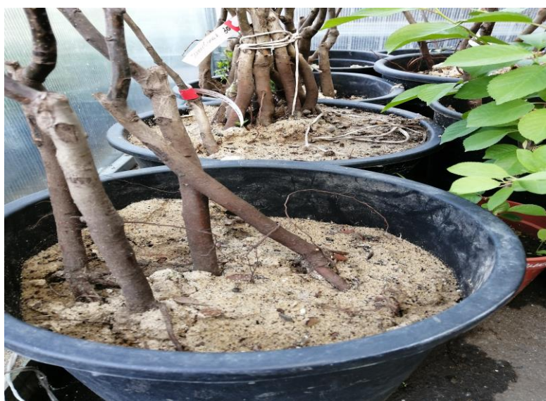
Саженцы, произведенные по технологии производства с открытой корневой системой, помещенные в сосуды после окончания сезона весенней реализации. Продажа по адресу: г. Барнаул, ул. Взлётная, 2к.

Продавцы, допустили нарушение правил продажи семян и посадочного материала на рынках и в местах сезонной торговли, предлагали 19 469 пакетиков семян овощных и цветочных растений, 577,5 кг лука-севка, 6796 луковиц цветочных растений и 47 180 саженцев плодовых, ягодных, декоративных растений и рассады садовой земляники, не представив покупателям обязательной информации о сортовой принадлежности, происхождении и качестве.